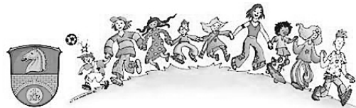
Diakonie Diakonisches Werk Gießen

Wer sich für die Digitalisierung im Landkreis Gießen interessiert, findet alle Informationen auf der neuen Internetseite unter smart.lkgi.de . Hier lässt sich nicht nur die Strategie nachlesen ( https://smart.lkgi.de/wp-content/uploads/2023/06/Smart-Region-Strategie-Landkreis-Giessen.pdf ), sondern auch weiterhin an einer Umfrage teilnehmen ( isgb.gutbefragen.de/smartes-giessenerland ). Darüber hinaus liegt die Umfrage in den Stadt- und Gemeindeverwaltungen aus. Fragen beantwortet das Projektteam gerne per E-Mail an smart.region@lkgi.de .