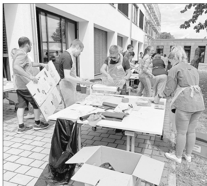
Notfallübung zur Rettung historischen Archivguts: Archivpersonal aus den Kreiskommunen lernte in der Volkshochschule in Lich den richtigen und raschen Umgang mit durchnässten Dokumenten.

„Die Zusammenarbeit ist ein großer Gewinn für alle Beteiligten im Landkreis“, sagte Landrätin Anita Schneider: Neben der gegenseitigen Hilfe im Notfall sollten auch objektbezogene Pläne für die Archive erstellt werden, die über den Katastrophenschutz des Landkreises der Feuerwehr zur Verfügung stehen. „Und zusätzlich ermöglicht der Austausch auch eine bereichernde Zusammenarbeit, wenn es um gemeinsame Ausstellungen oder Aktionen geht.“